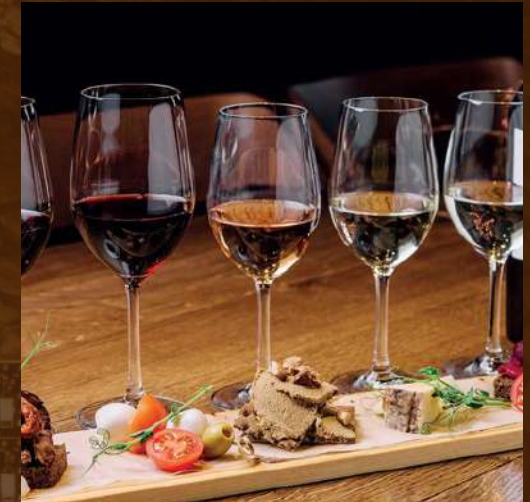
ICONIC TUR 750 MDL/pax