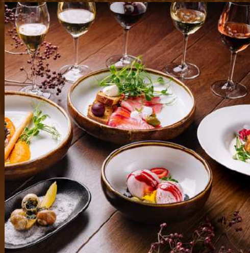
FUSION TUR 1250 MDL/pax