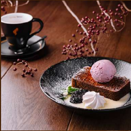
FAMILY TUR 400 MDL/pax