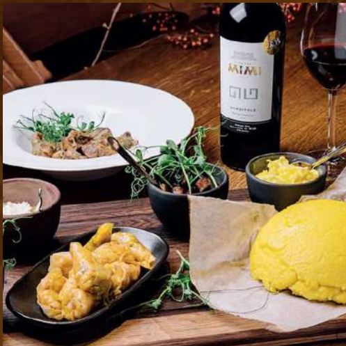
AUTHENTIC TUR 1000 MDL/pax