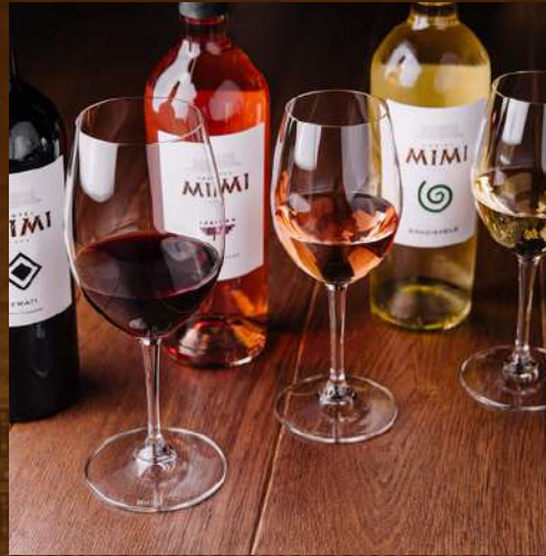
CLASSIC TUR 400 MDL/pax