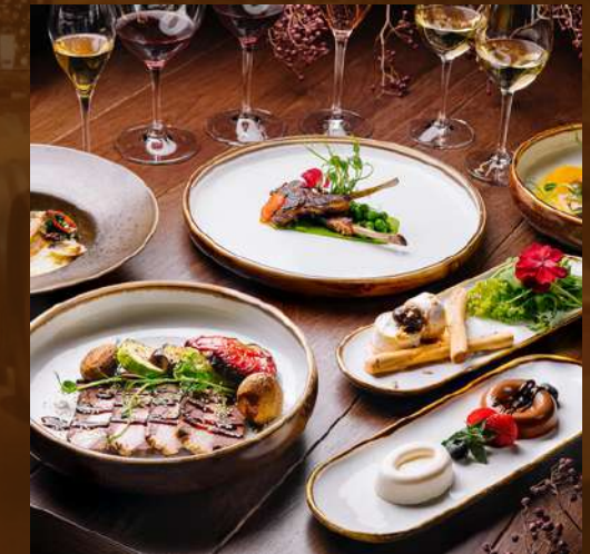
GOVERNOR TUR 3000 MDL/pax

N.B. Click pe "Tur" pentru a afla mai multe